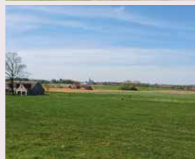
↑ Zicht op kerktoren Ingooigem ↓ Dolage-fruitbloesems